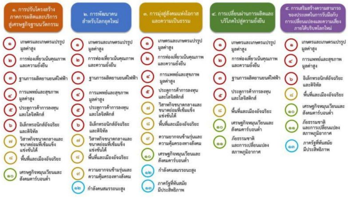
แผนภาพที่ ๓.๑ ความเชื่อมโยงระหว่างหมุดหมายการพัฒนา กับเป้าหมายหลัก

กัน ทำให้หมุดหมายแต่ละประการสามารถสนับสนุนเป้าหมายหลักได้มากกว่าหนึ่งข้อ นอกจากนี้ การพัฒนาภายใต้แต่ละหมุดหมายไม่ได้แยกขาดจากกัน แต่มีการสนับสนุนหรือเอื้อประโยชน์ซึ่งกันและกัน